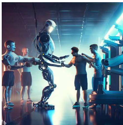
Queste immagini della "palestra del futuro" sono state generate dall'Intelligenza Artificiale