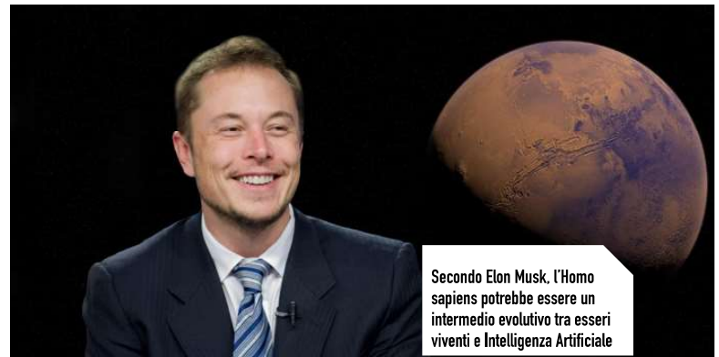
Secondo Elon Musk, l' Homo sapiens potrebbe essere un intermedio evolutivo tra esseri viventi e Intelligenza Artificiale